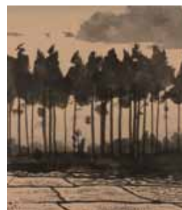
6. 田中一村 《杉林暮景》 千葉市美術館蔵(新山宏氏寄贈) ©2012 Hiroshi Niiyama