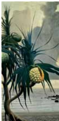
5. 田中一村 《アダンの海辺》 昭和44年(1969) 個人蔵(千葉市美術館寄託) ©2012 Hiroshi Niiyama