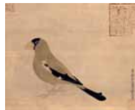
3. 土佐光起 《豆鳥図》江戸時代前期 嬉遊会コレクション (千葉市美術館寄託)