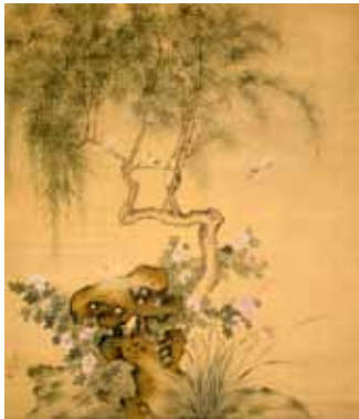
1. 立原杏所 《花木図》江戸時代後期 重要美術品 嬉遊会コレクション (千葉市美術館寄託)