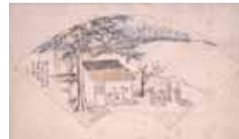
2. 渡邊崋山 《田園雜興詩画》のうち「第十二 冬日」 天保12年(1840) 嬉遊会コレクション (千葉市美術館寄託)