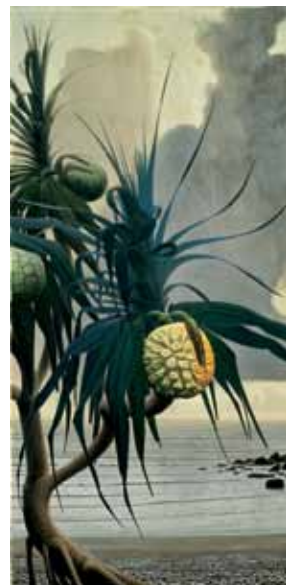
田中一村《アダンの海辺》昭和44年（1969） 個人蔵（千葉市美術館寄託）©2012 Hiroshi Niiyama