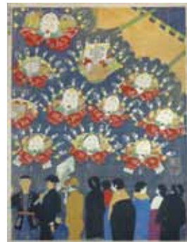
4. 小泉癸巳男 《昭和大東京百図絵》より 〈浅草 西の市〉 昭和3～12年(1928～1937) 個人蔵(千葉市美術館寄託)