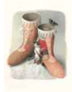
3. 【子ども審査員賞】 いまいあやの 『くつやのねこ』より 2008年 ©いまいあやの