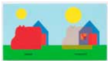
4. 【金のりんご賞】 ジャニク・コアト 『わたしのカバ』より 2010年 ©Janik Coat