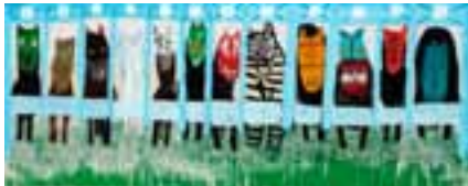
1. 【グランプリ】 チョ・ウンヨン 『はしれ、トト!』より 2010年 ©Eun young Cho

展覧会広報用として作品画像をご用意しております。是非、本展をご紹介しますようお願いいたします。ご紹介いただけます場合は、別紙の申込書に必要事項をご記入の上、FAXにてご連絡下さい。使用はお申し込みの通り1回限りとし、次ページの「写真ご利用に際してのお願い」の内容をご了承ください。