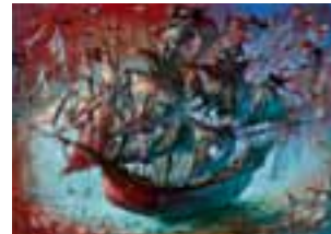
6. ペテル・ウフナール 『ピーターパン』より 2007年 ©Peter Uchnár