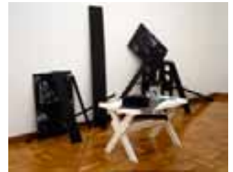
斎藤義重（Seisaku Ino）1985年千葉市美術館蔵

現代日本美術のパイオニア、斎藤義重（1904-2001）。70年以上にわたる制作は、実験的な精神に裏打ちされていました。今回は黒い板を用いた「複合体」シリーズをはじめ80年代以降の作品を中心に紹介します。