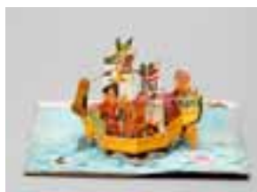
8. 松丘富雄編・黒崎義介ほか画 『おとぎばなし童謡集 どうよう』 1958年頃・光文社刊 梅花女子大学図書館蔵