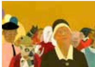
5. 【金牌】 シモーネ・レア 『イソップ物語』より 2011年 ©Simone Rea