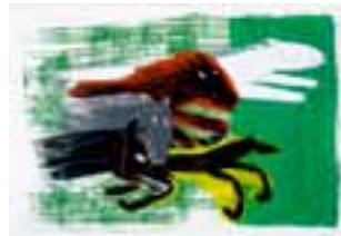
2. 【グランプリ】 チョ・ウンヨン 『はしれ、トト!』より 2010年 ©Eun young Cho