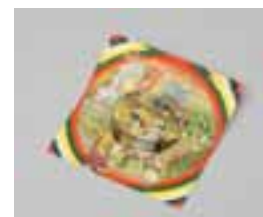
9. 『四十二変化 公園と郊外遊』 1915年・富里昇進堂刊 札幌市中央図書館蔵