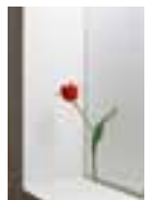
須田悦弘（チューリップ）

本物と見紛う花や草の彩色木彫でインスタレーションを生み出す現代作家、須田悦弘。本展では、初期から現在に至る彼の代表作を紹介するとともに、新たに制作された新作インスタレーションも展示します。須田にとって、首都圏初の大規模な個展となります。