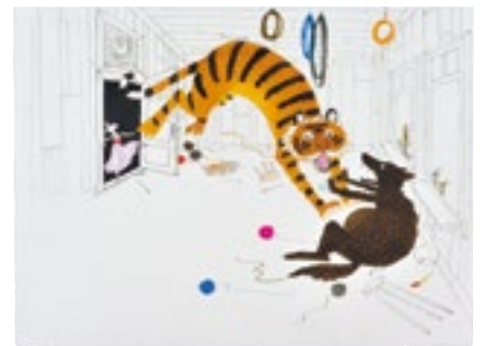
4. アンネマリー・ファン・ハーリングン 《シラユキさん モンスターを編む》BIB2015 金牌 ©Annemarie van Haeringen