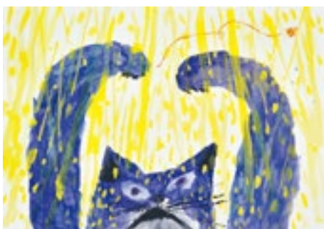
2. ミロコマチコ《オレときいろ》BIB2015 金のりんご賞 ©mirocomachiko