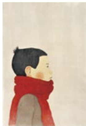
6. 松本大洋《かないくん》BIB2015参加 ©Taiyo Matsumoto