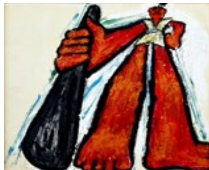
9. たしませいぞう《ちからたろう》BIB1969 金のりんご賞 刈谷市美術館蔵 ©Seizo TASHIMA