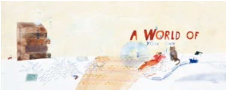
1. ローラ・カーリン《あなたが作る世界》BIB2015 グランプリ ©Laura Carlin

展覧会広報用として作品画像をご用意しております。是非、本展をご紹介くださいますようお願いいたします。ご紹介いただける場合は、別紙の申込書に必要事項をご記入の上、FAXにてご連絡ください。画像の使用は1回限りとし、展覧会紹介の目的にのみご使用ください。