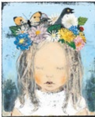
5. 酒井駒子《金曜日の砂糖ちゃん》 BIB2005 金牌 ©Komako SAKAI