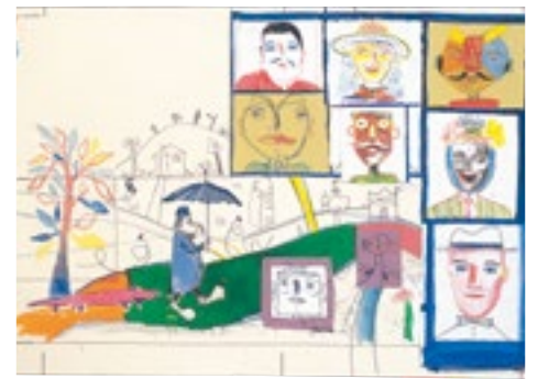
10. 大竹伸朗《ジャリおじさん》BIB1995 金牌 ©Shinro Ohtake, Courtesy of Take Ninagawa, Tokyo