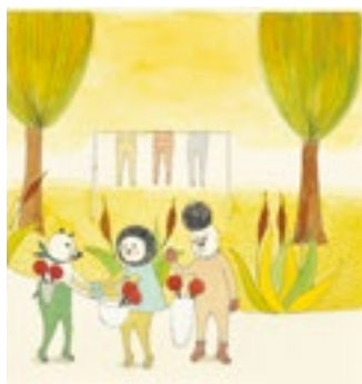
8. 樋勝朋巳《きょうはマラカスのひ》 BIB2015 参加 ©Tomomi HIKATSU