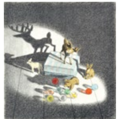
7. みやこしあきこ《かいちゅうでんとう》 BIB2015 参加 ©Akiko MIYAKOSHI