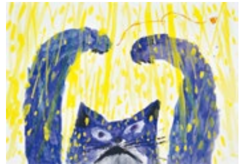
ミロコマチコ 《オレときいろ》BIB2015 金のりんご賞 ©mirocomachiko

協力:スロヴァキア国際児童芸術館(BIBIANA)、一般社団法人 日本国際児童図書評議会(JBBY)