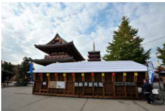
5.《油絵茶屋再現》2011年 作家蔵