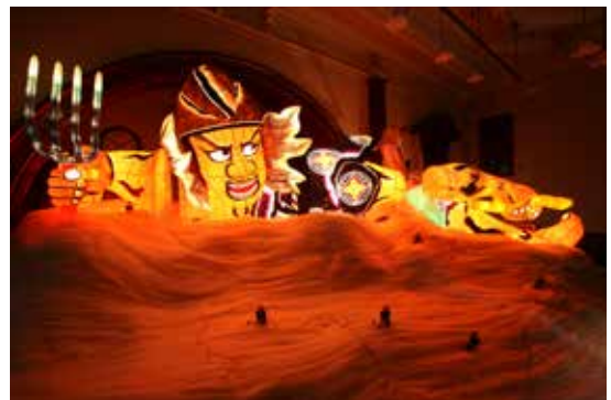
4.《金沢七不思議》2008年 金沢21世紀美術館蔵