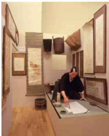
3.《醤油画資料館》1999年 福岡アジア美術館蔵