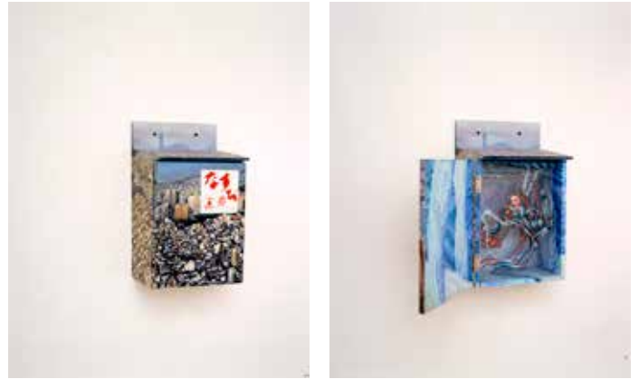
2.《新なすび画廊ーマルチェラ・トゥルジーロ「脱皮する女」》 1997年 作家蔵