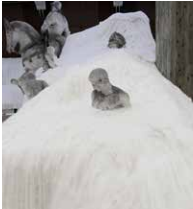
1.《不完全》2017年（展示風景：「東京藝術大学130周年記念 藝大茶会それゆえに」、東京藝術大学大石膏室）

展覧会広報用として作品画像をご用意しております。是非、本展をご紹介くださいますようお願いいたします。ご紹介いただける場合は、別紙の申込書に必要事項をご記入の上、FAXにてご連絡ください。画像の使用は1回限りとし、展覧会紹介の目的にのみご使用ください。