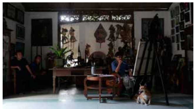
6.《帰って来たペインターF》2015年 森美術館蔵