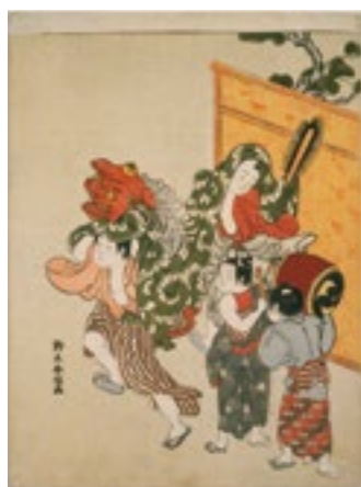
3. 鈴木春信《子どもの獅子舞》 中判錦絵 明和4-5年(1767-68)頃 William Sturgis Bigelow Collection, 11.19466 Photograph © 2017 Museum of Fine Arts, Boston