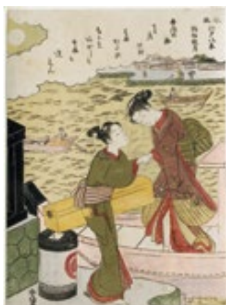
5. 鈴木春信《風流江戸八景 駒形秋月》 中判錦絵 明和5年(1768)頃 William Sturgis Bigelow Collection, 11.19500