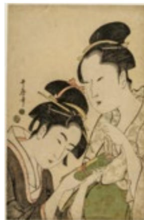
7. 喜多川歌麿《おきたとお藤》 大判錦絵 寛政5-6年(1793-94) William Sturgis Bigelow Collection, 11.14282