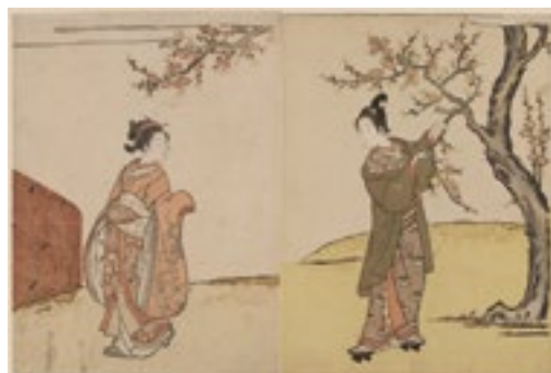
2. 鈴木春信《桃の小枝を折り取る男女》 中判錦絵2枚続 明和3年(1766)頃 William Sturgis Bigelow Collection, 11.19448, 11.19506