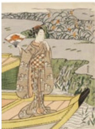
1. 鈴木春信《見立玉虫 屋島の合戦》 中判錦絵2枚続のうち左 明和3-4年(1766-67)頃 Bequest of Miss Ellen Starkey Bates, 28.195

展覧会広報用として作品画像をご用意しております。是非、本展をご紹介くださいますようお願いいたします。ご紹介いただける場合は、別紙の申込書に必要事項をご記入の上、FAXにてご連絡ください。画像の使用は1回限りとし、展覧会紹介の目的にのみご使用ください。