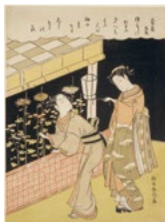
4. 鈴木春信《寄菊 夜菊を折り取る男女》 中判錦絵 明和6-7年(1768-70)頃 Nellie Parney Carter Collection—Bequest of Nellie Parney Carter, 34.345