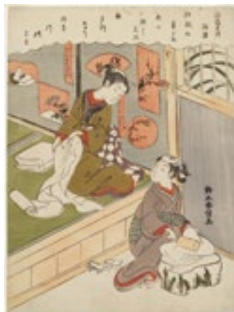
6. 鈴木春信《六玉川 搦衣の玉川》 中判錦絵 明和5年(1768)頃 William Sturgis Bigelow Collection, 11.19469