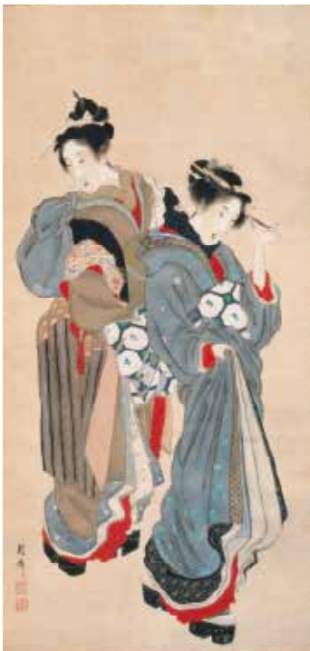
4.沼田月斎《二美人図》名古屋市博物館蔵 (展示期間 4/6-5/6)