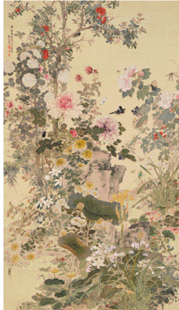
2.山本梅逸《花卉草虫図》名古屋市博物館蔵 (展示期間 4/6-5/6)