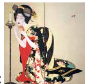
岡本神草《口紅》 大正7年 京都市立芸術大学芸術資料館蔵