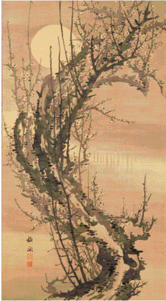
1.菅井梅閑《梅月図》仙台市博物館蔵

展覧会広報用として作品画像をご用意しております。是非、本展をご紹介しますようお願いいたします。ご紹介いただける場合は、別紙の申込書に必要事項をご記入の上、FAXにてご連絡ください。画像の使用は1回限りとし、展覧会紹介の目的にのみご使用ください。