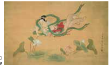
菱川師宣《天人採蓮図》 元禄(1688～1704)前期 千葉市美術館蔵