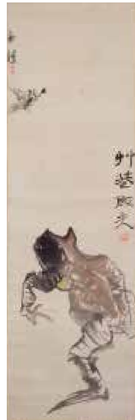
6.林十江《蝦蟇図》東京国立博物館蔵