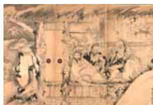
曾我蕭白《竹林七賢図》(部分) 旧永島家模絵 三重県立美術館蔵 重要文化財

※都合により予告なく展覧会名、内容の一部が変更となる場合がありますのでご了承ください。