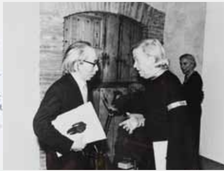
《遺作》の扉の前の瀧口修造とティニー・デュシャン 1973年 慶應義塾大学アート・センター蔵

after MARCEL DUCHAMP * 2012 日本語で「検眼図」 2012 日本語で「Oculist Witnesses」 Toua Duchamp 自身は 1-1 (既述) 13) 2012 Témoin oculistes 2012 年 eaux d'oculiste 2012 Tableaux oculistes