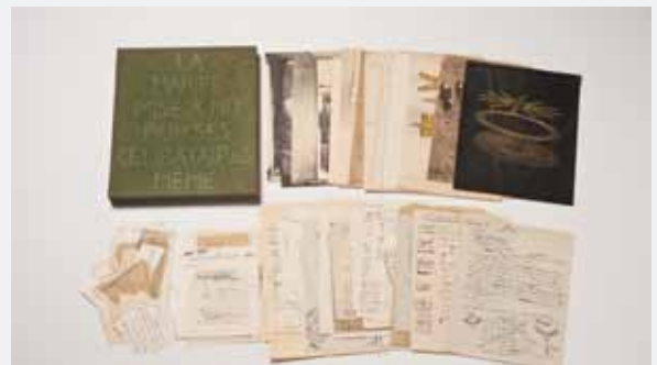
マルセル・デュシャン 瀧口修造旧蔵の《グリーン・ボックス》 1934年 個人蔵