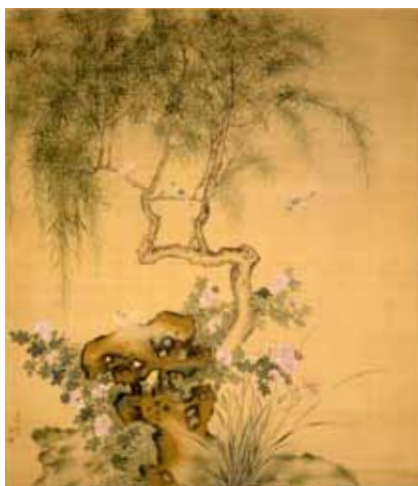
立原杏所《花木図》 江戸時代 嬉遊会コレクション