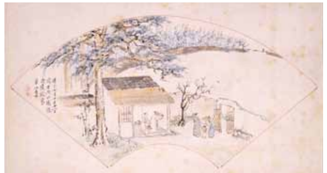
渡辺華山(田園雑興詩画)より「第十二 冬日」 天保11年(1840) 嬉遊会コレクション