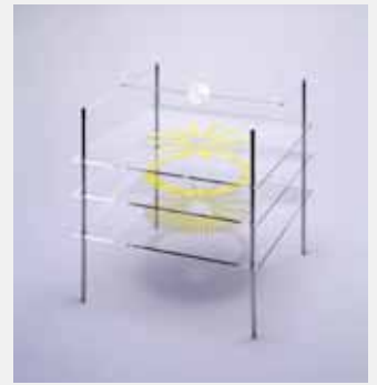
瀧口修造、岡崎和郎《検眼圖》1977年 千葉市美術館蔵

が記されています。また荒川修作のニューヨークでの展覧会を見るようにデュシャンに薦めたり、南画廊でオブジェの展覧会を開く計画や、「語録」の非売エディション10部を誰に贈るかの相談なども興味深い記述です。雑誌等に書かれた文章に見られる控え目な語り口とは異なり、デュシャンへの手紙では、瀧口は意外なほど積極的に自らの要望を伝えています。これらの書簡と下書きは、「瀧口修造＝マルセル・デュシャン書簡資料集」として本展覧会の図録に収められています。関心をお持ちのかたはぜひご一読ください。