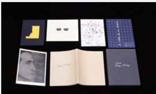
瀧口修造 『マルセル・デュシャン語録』 1968年 富山県立近代美術館蔵

と瀧口はのちにこのときの様子を回想しています。この短時間の会見の際ダリからデッサン、デュシャンからサインをもらいましたが、おそらくタクシーに置いてきてしまったのでしょうか、2台もカメラを持ち歩いていたにもかかわらず、写真を撮ることはできなかったようです。