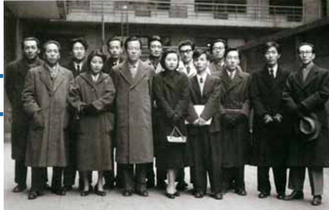
実験工房のメンバー 1954年頃

彼らの活動は、共同制作という面ではセルゲイ・ディアギレフ(1872-1929)が率いたロシア・バレエ団(バレエ・リュス 1909-