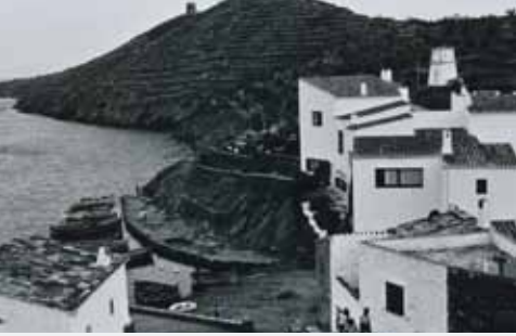
瀧口修造撮影 カダケスのダリ邸 1958年 慶應義塾大学アート・センター蔵