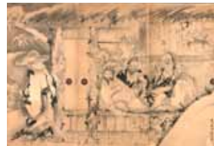
曾我蕭白《竹林七賢図》(部分) 旧永島家模絵 三重県立美術館蔵 重要文化財

※都合により予告なく展覧会名、内容の一部が変更となる場合がありますのでご了承ください。