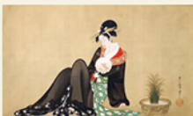
喜多川歌麿(納涼美人図) 寛政6-7年(1794-95)頃