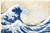
葛飾北斎(富嶽三十六景 神奈川沖浪裏) 天保2-4年(1831-33)頃

8月4日(火)~9月6日(日) 描かれた千葉市と房総の海辺/美人面百花 肉筆浮世絵 夏休み特集 妖怪も大行進/特集 草間彌生