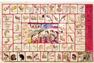
《動物第一 麒麟一覧図》木版画 明治15年(1882)頃 青木コレクション(複製)