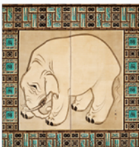
猪一真(象図原稿) 二曲一屏 江戸時代前期

※内容やイベントが変更になる場合があります。最新の状況はホームページをご確認ください。