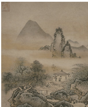
惟醫周徳《山水図》 室町時代