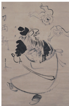
仙厓義梵《鍾馗図》 江戸時代