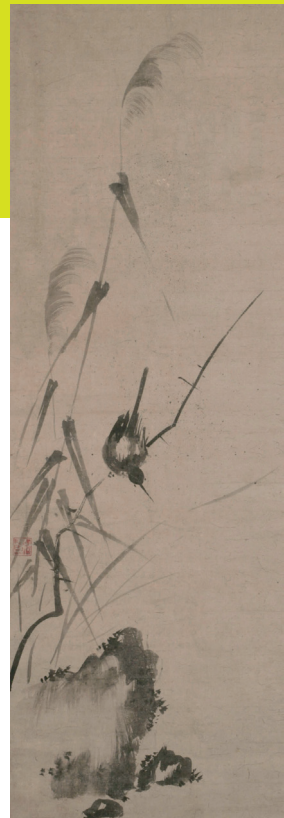
知有《翡翠翠》 室町時代