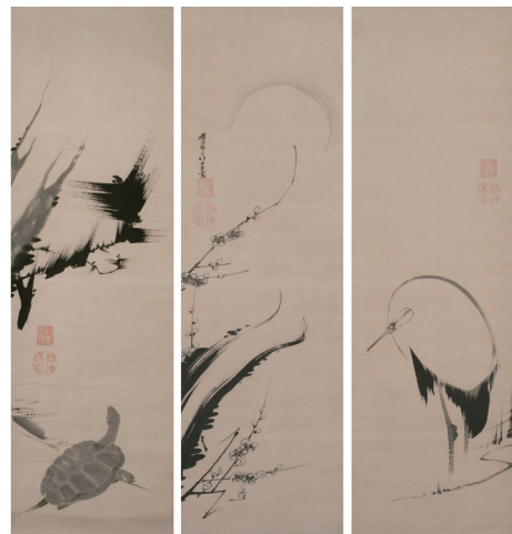
伊藤若冲《梅月鶴亀図》 寛政7(1795)年