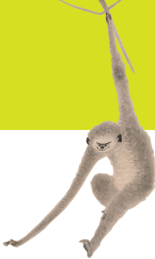
海北友松《翎毛禽獸図》(部分) 桃山時代

前回の展覧会を見逃した方も、そうでない方も是非、あらためてお楽しみいただけるよう、その後判明したドラッカーの収集に関する新しい資料も交えた約50点で展示を構成いたします。雪村から若冲まで——。どうぞご期待ください。