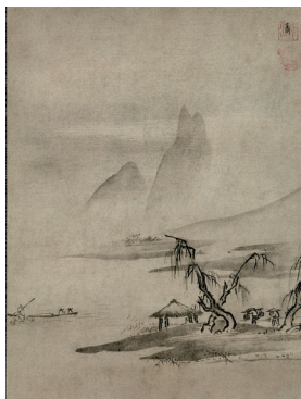
如水宗淵《柳堤山水図》 室町時代