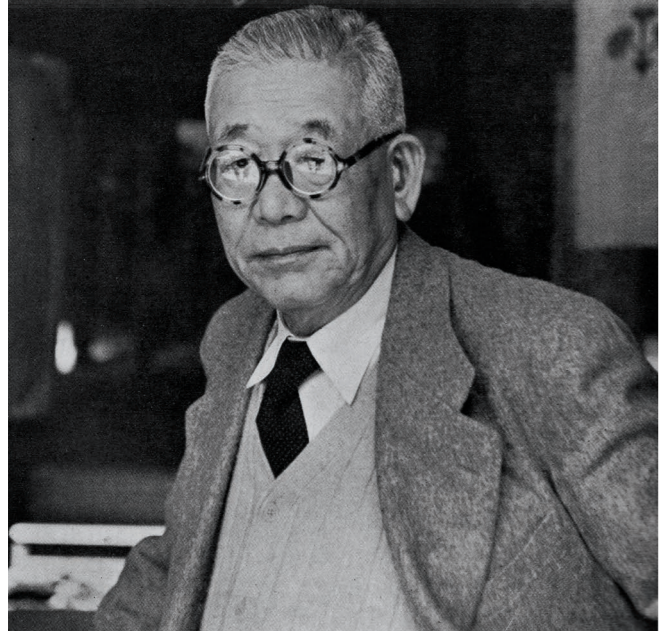
北大路魯山人 上賀茂神社にて