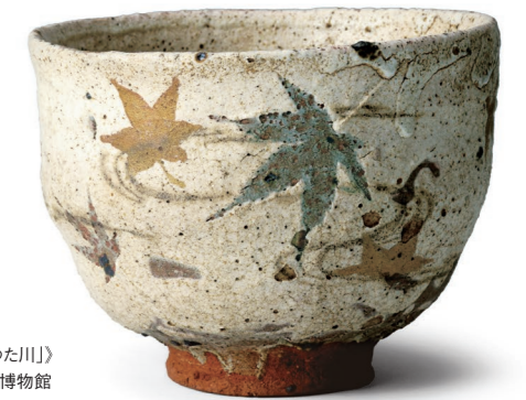
川喜田半泥子(粉引茶碗 銘「たつた川」) 1945-54年(昭和20年代) 石水博物館