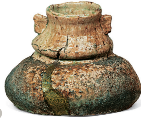
川喜田半泥子 (伊賀水指 銘「窓袋」) 1940(昭和15)年 石水博物館