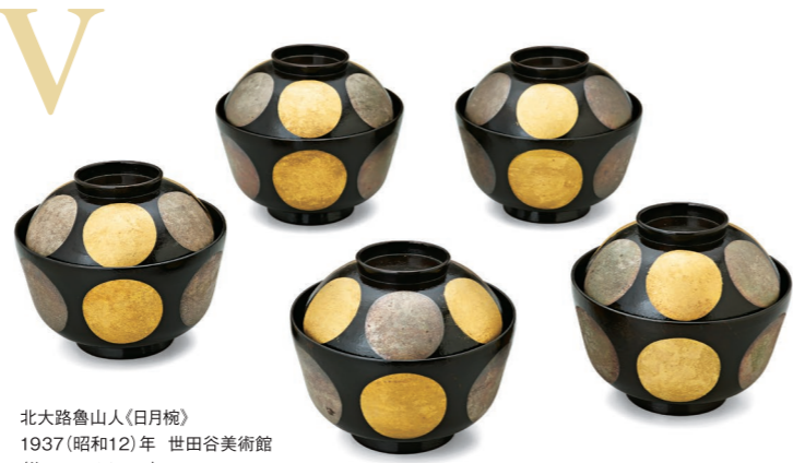
北大路魯山人(日月碗) 1937(昭和12)年 世田谷美術館 (塩田コレクション)