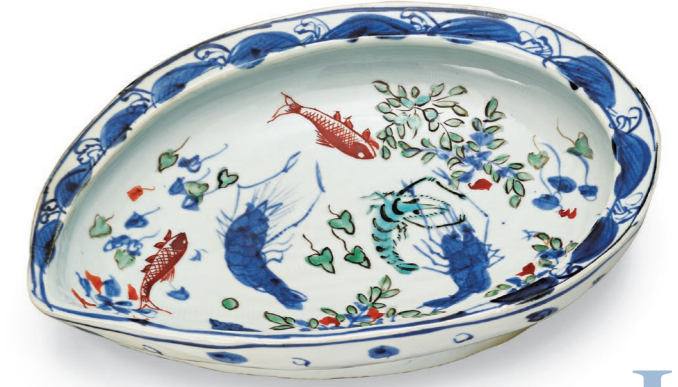
北大路魯山人(色絵魚藻文染付鮭形鉢) 1935-44年(昭和10年代) 世田谷美術館 (塩田コレクション)