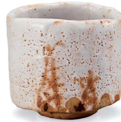
荒川豊蔵(志野筋絵茶碗 銘「随縁」) 1961(昭和36)年 荒川豊蔵資料館