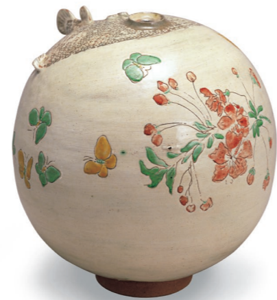
八木一夫(春の海) 1947(昭和22)年 個人蔵