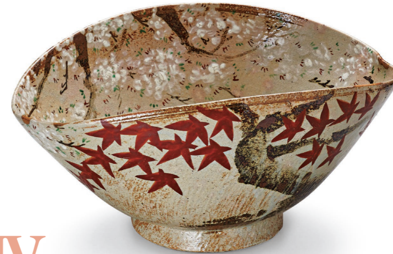
北大路魯山人(雲錦大鉢) 1940(昭和15)年 世田谷美術館(塩田コレクション)