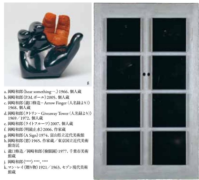
a. 岡崎和郎《hear something...》1966、個人蔵 b. 岡崎和郎《P.M. ボール》2005、個人蔵 c. 岡崎和郎《瀧口修造—Arrow Finger (人名録より)》1968、個人蔵 d. 岡崎和郎《タトリン—Giveaway Tower (人名録より)》1969/1972、個人蔵 e. 岡崎和郎《ライトフルーツ》2007、個人蔵 f. 岡崎和郎《明鏡止水》2006、作家蔵 g. 岡崎和郎《A Sign》1974、富山県立近代美術館蔵 h. 岡崎和郎《窓》1965、作家蔵/東京国立近代美術館寄託 i. 瀧口修造/岡崎和郎《検眼圖》1977、千葉市美術館蔵 j. 岡崎和郎《(****) ****、****》 k. マン・レイ《贈り物》1921/1963、セゾン現代美術館蔵