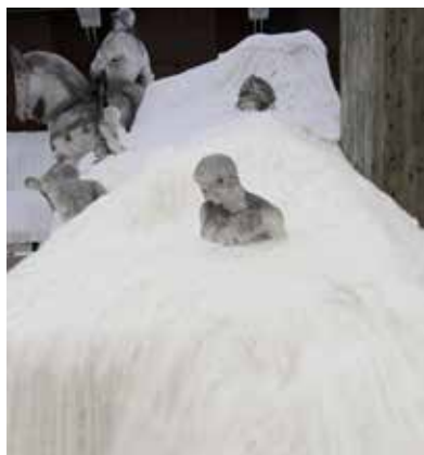
1.《不完全》2017年（展示風景:「東京藝術大学130周年記念 藝大茶会それゆえに」、東京藝術大学大石膏室）

展覧会広報用として作品画像をご用意しております。是非、本展をご紹介くださいますようお願いいたします。ご紹介いただける場合は、別紙の申込書に必要事項をご記入の上、FAXにてご連絡ください。画像の使用は1回限りとし、展覧会紹介の目的にのみご使用ください。