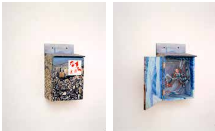
2.《新なすび画廊ーマルチェラ・トゥルジーロ「脱皮する女」》 1997年 作家蔵