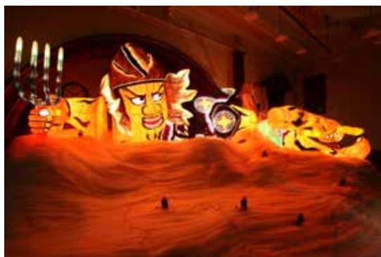
4.《金沢七不思議》2008年 金沢21世紀美術館蔵