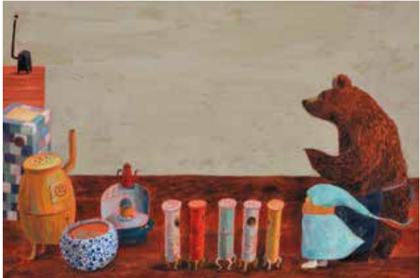
日本 降矢なな『ひめねずみとガラスのストーブ』 ©降矢なな