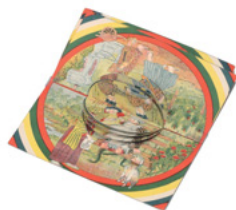
『四十二変化 公園と郊外遊』1915年・富里昇進堂刊 札幌市中央図書館蔵