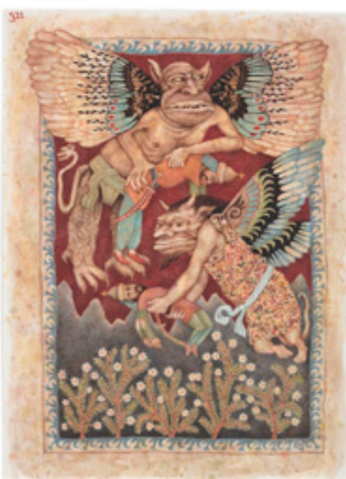
ダーヴィト・ウルスィーニ 『千夜一夜物語5』より 2010年 ©David Ursiny