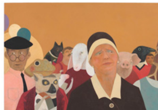
【金牌】シモーネ・レア 『ゾッポ物語』より 2011年 ©Simone Rea