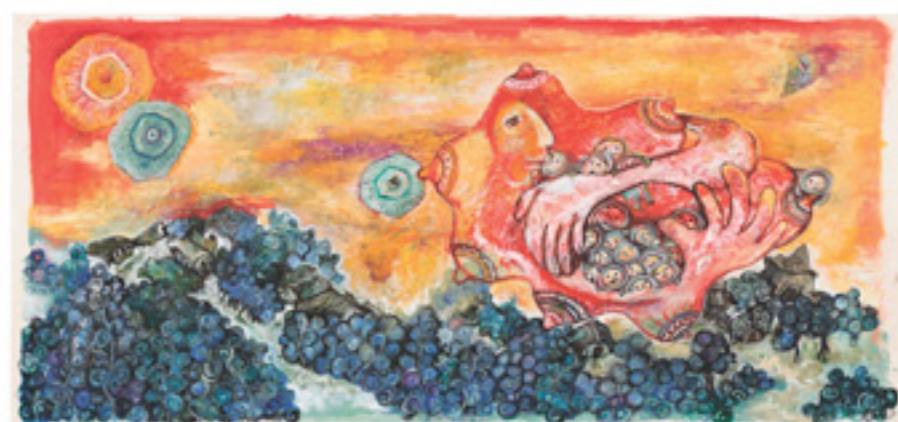
大畑いくの「そののおっばい」より 2007年 ©大畑いくの