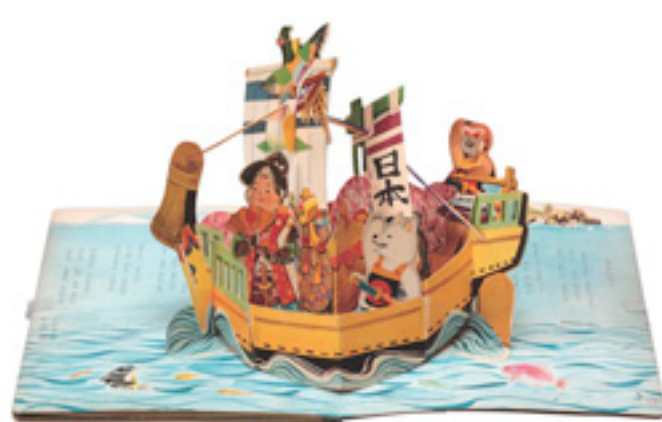
松丘富雄編・黒崎義介ほか画「おとぎばなし童謡集 どうよう」 1958年頃・光文社刊 梅花女子大学図書館蔵