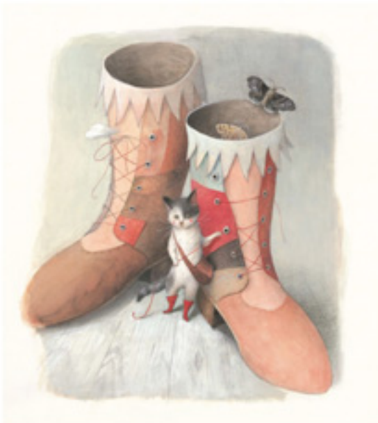
【子ども審査員賞】いまいあやの 『くつやのねこ』より 2008年 ©いまいあやの