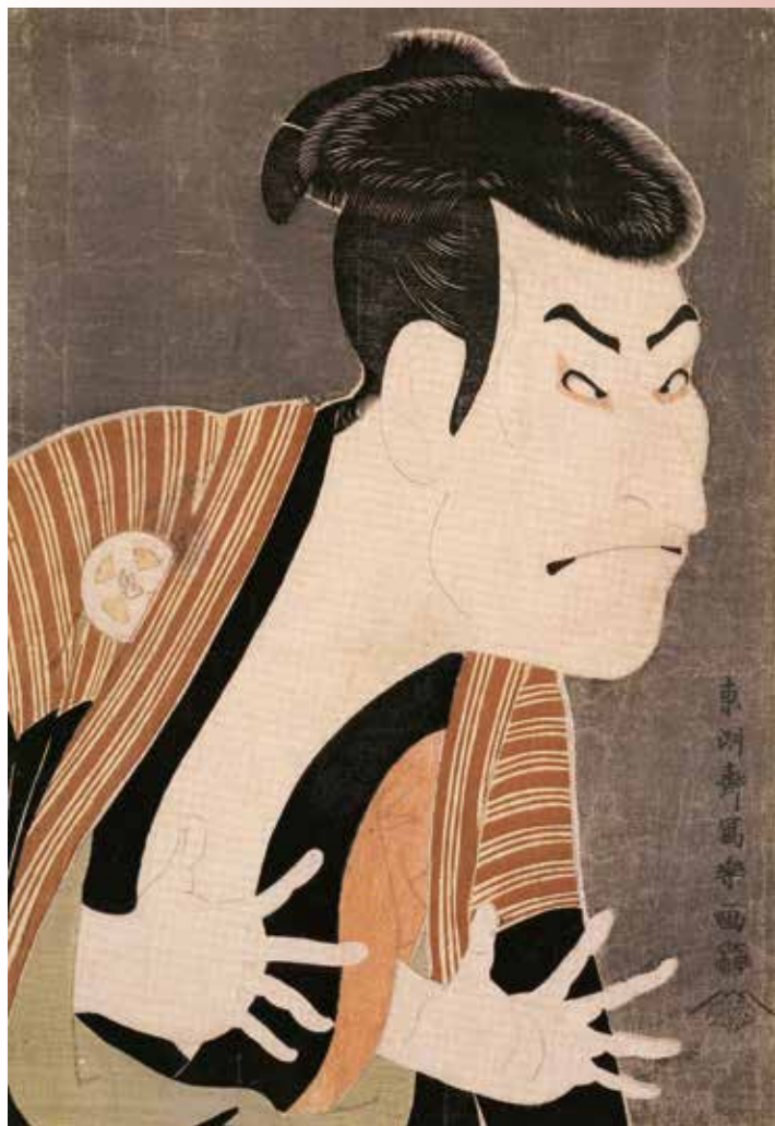
東洲斎写楽《三代目大谷鬼次の江戸兵衛》寛政6年(1794)頃 大判錦絵