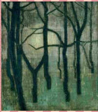
1 昭和13(1938)年頃 紙本着色一面 吉田善彦《月の林》