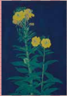
2 大正中期 絹本着色一幅 中村岳陵《橘》