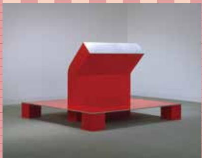
4 昭和63年(1988) アルミニウム(着彩) 清水九兵衛《F-COPE》