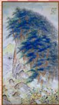
6 昭和18年(1943) 紙本着色一面 田岡春径《秋晴》