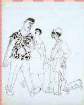
5 遠藤健郎《白描戯画》より《勇士の再会》