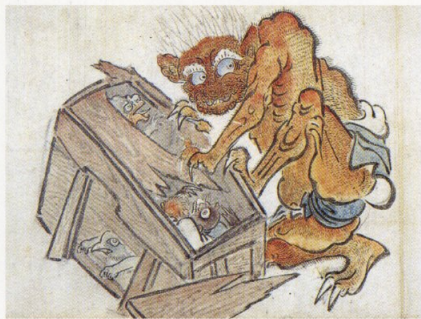
白隠筆 法具妖変之図(百鬼夜行図巻) 金臺寺蔵