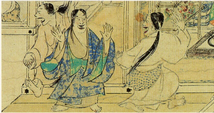
信貴山縁起絵巻 朝護孫子寺蔵 (住吉模本展示)