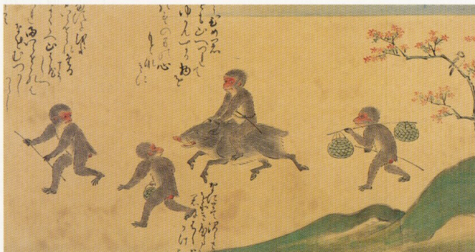
藤袋草子絵巻 サントリー美術館蔵