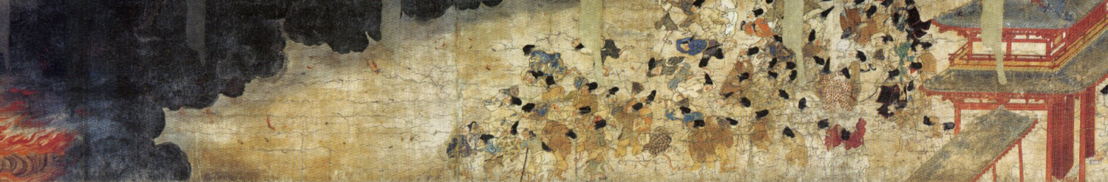
伴大納言絵巻 出光美術館蔵 (出光美術館蔵複製展示)