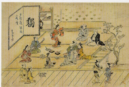
「よしはらの軒 揚屋大寄」