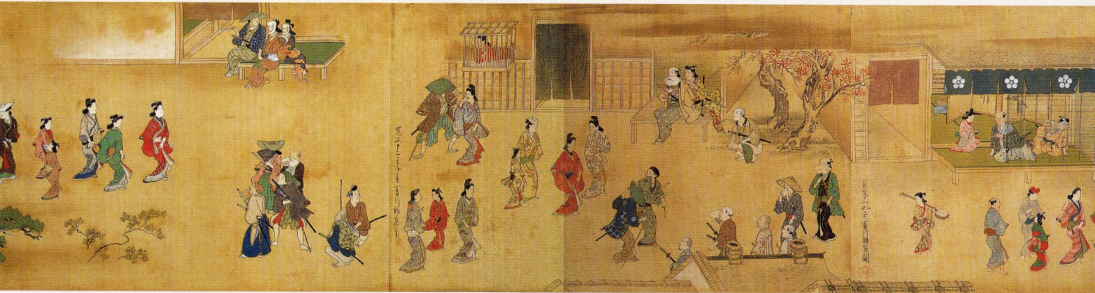
「北楼及び演劇図巻」(部分) 東京国立博物館蔵

菱川師宣(～1694)は、安房国保田(現千葉県鋸南町)の出身で、江戸において風俗画に新様を樹立し、浮世絵派の祖と仰がれている絵師です。