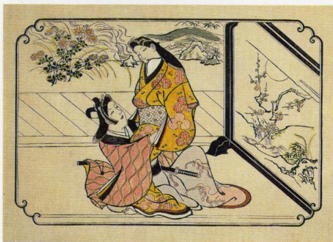
「衝立のかけ」平木浮世絵美術館蔵