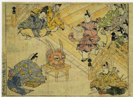
「酒呑童子 褒賞」千葉市美術館蔵