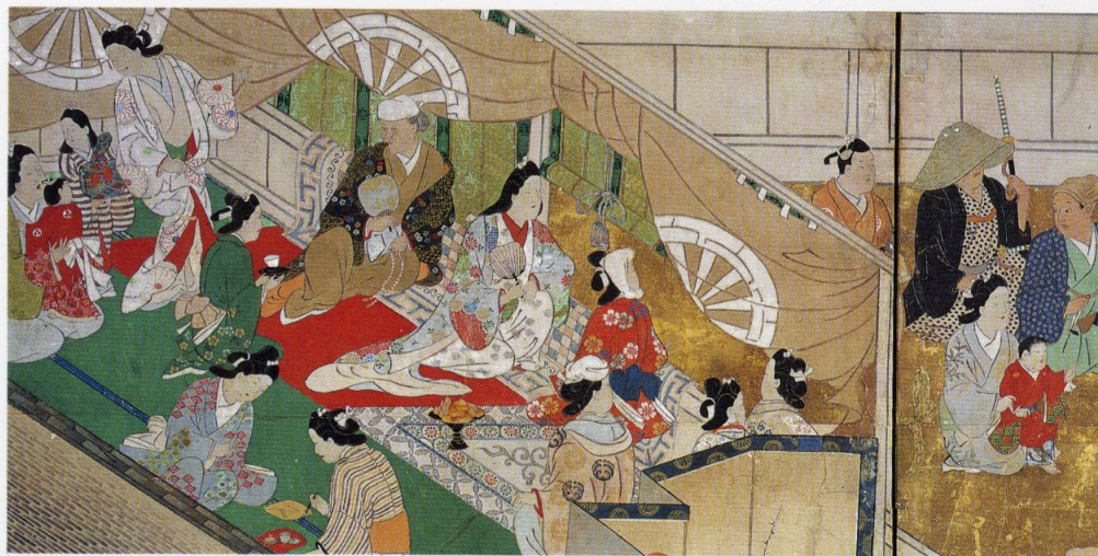
「歌舞伎図屏風」(部分) 東京国立博物館蔵 重要文化財

千葉市美術館は「喜多川歌麿展」で開館し、このたび開館五周年を迎えます。そこで、浮世絵の出発点に位置づけられる菱川師宣の全容を提示し、その魅力を紹介する特別展を開催しようというものです。