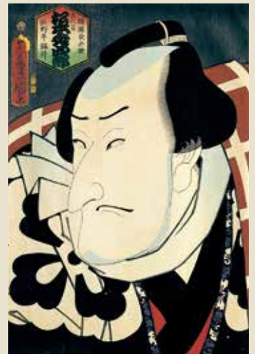
三代歌川豊国「五代目松本幸四郎の幡隨長兵衛」