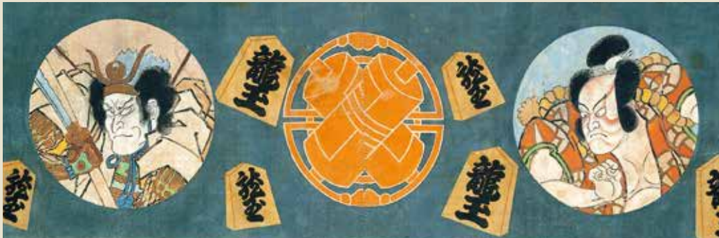
三代歌川豊国「三代目中村歌右衛門七回忌曳幕」(部分)