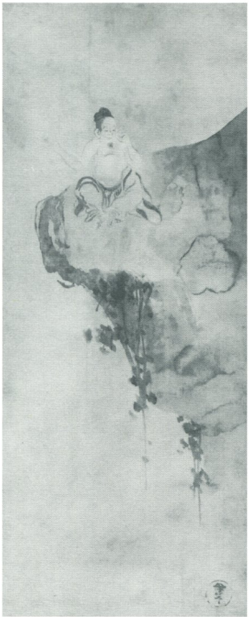
伊年印「許由巢父図」元和寛永期(後期展示)