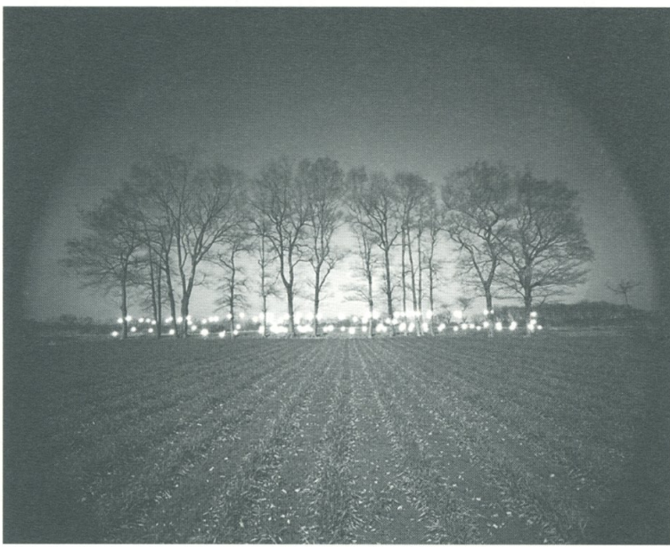
佐藤時啓「Breath・Graph」#63 一九八九一九〇年