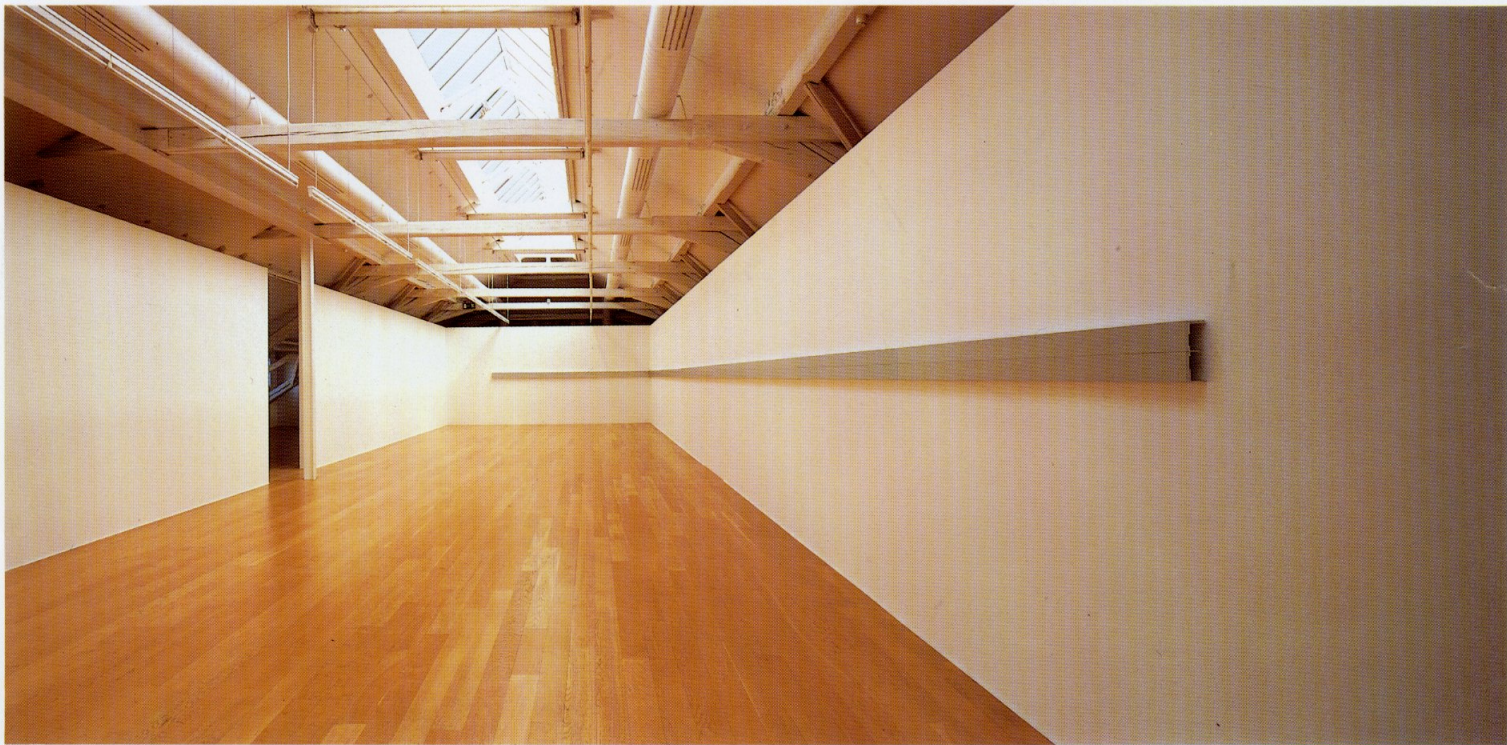
ロイトリンゲン(ドイツ)でのプロジェクト[1995/96年]