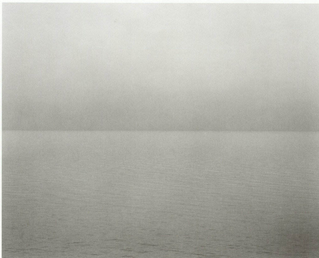
Hiroshi Sugimoto <Lake Superior Cascade River 1995>

時間・空間・光をあやつる5人の現代芸術家 | ニエロ・トローニ、ミシェル・ヴェルジュ、マリア・ノルトマン、杉本博司、宮島達男