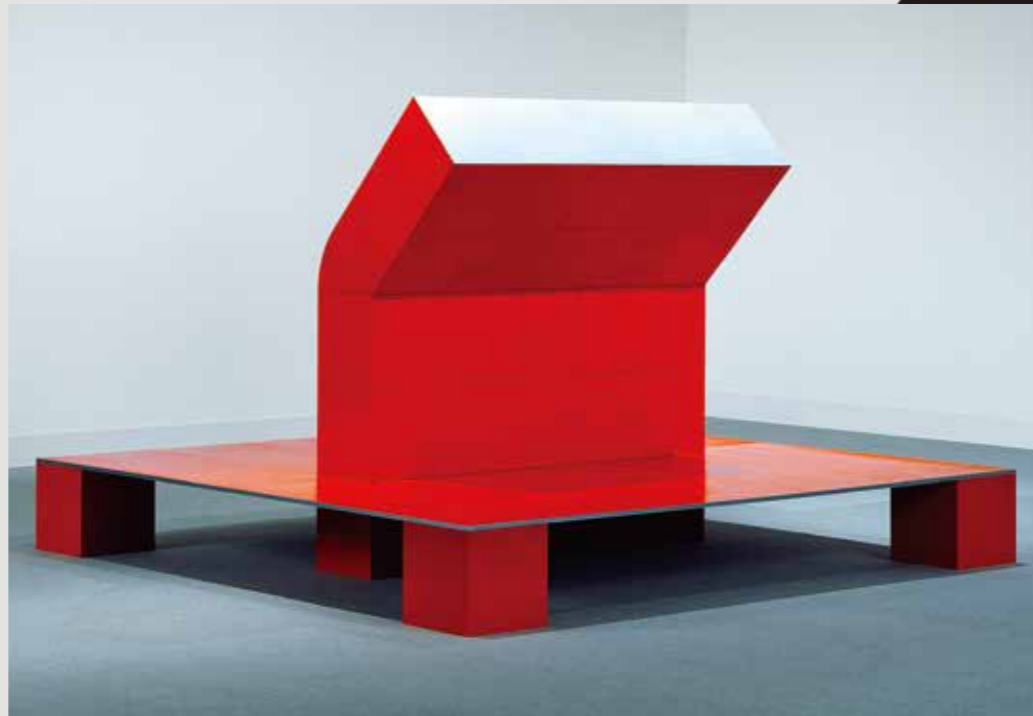
《FIGURE 16》1988年 千葉市美術館蔵

44歳の時に五東衛の名で発表した初期彫刻作品から最晩年の大型作品まで、京都の街並みにインスピレーションを得た約40年におよぶ抽象彫刻の多様な展開を回顧。