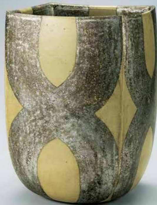
《方容(方容條文花器)》1958年 個人蔵 第1回日展特選