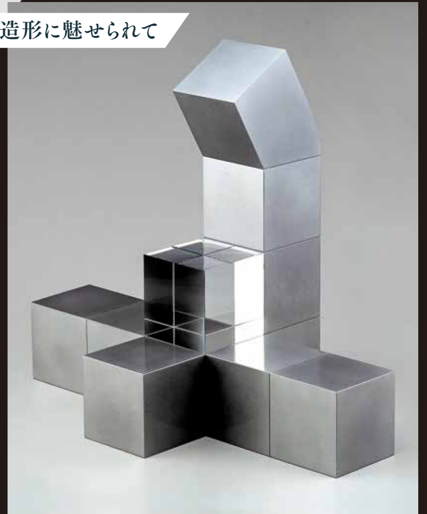
《CORRESPOND(刺印No.6)》2001年 千葉市美術館蔵