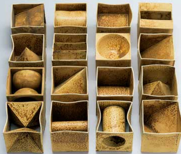
《ユニット・オブ・ジェ(一輪挿し)》1956年 個人蔵

1950年代に清水洋の名で発表した日展受賞作や、七代清水六兵衛を襲名した1980年代以降の陶芸作品を中心に、「用を秘めた感覚」が生み出した約80点を紹介。