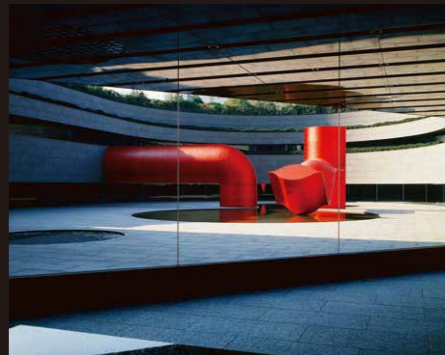
《朱龍》1984年 三井住友海上火災保険株式会社本店 ※本展覧会では図面などの資料を展示します。

第10回吉田五十八賞を受賞した《朱龍》(三井住友海上火災保険株式会社本店に設置)をはじめ、空間や建築との密接な関係にもとづいて制作された野外彫刻の図面やマケットほか資料を多数展示。