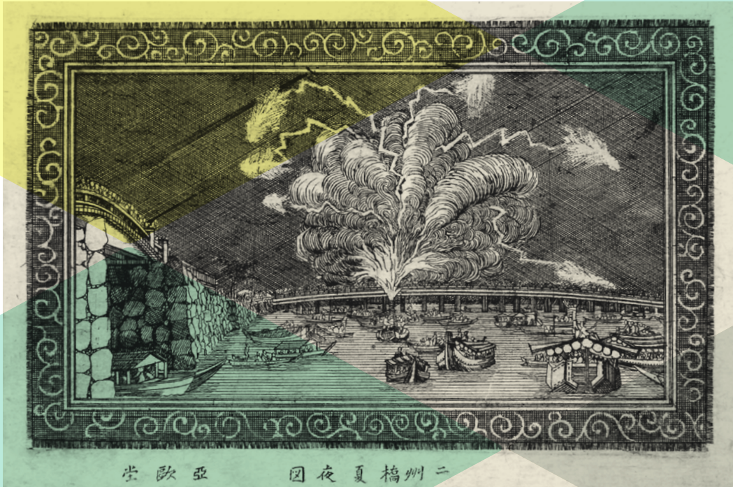
二州橋夏夜圖 (銅版東郷名画図のうき) 江戸時代 19世紀 重要文化財 須賀川市立博物館蔵

Aoda Denzen — A Western-Style Painter of