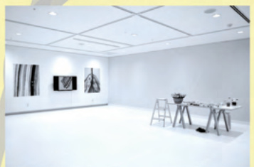
つくりかけラボ 11 金田実生 | 線の王国