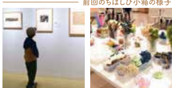
前回のちばしび小箱の様子