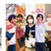
NPO 法人演劇百貨店 (演劇ワークショップファシリテーター/俳優)

日本全国の劇場や公民館、学校などで演劇ワークショップをしている団体です。楽しみながら表現活動できる場を作っています。