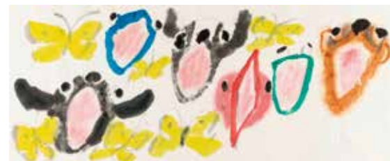
きくちき《ともだちのいろ》2021年 ©きくちき

「ブラチスラバからやってきた!世界の絵本パレード」の出品作家・きくちきさんをお招きし、ライブペインティングをおこないます。どなたでも自由にご覧いただけます。