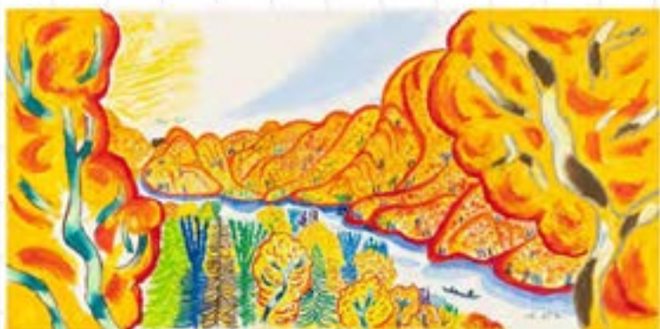
あべ弘士《よあけ》2021年 ©あべ弘士