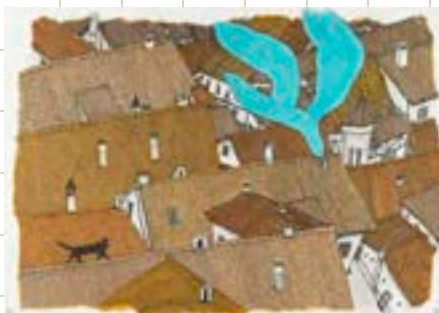
石川えりこ《ほんやねこ》2021年 ©石川えりこ