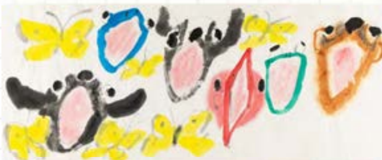
まぐちききく《ともだちのいろ》2021年 ©まぐちきき