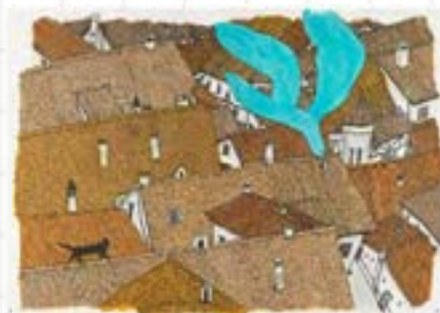
石川えりこ《ほんやねこ》2021年 ©石川えりこ