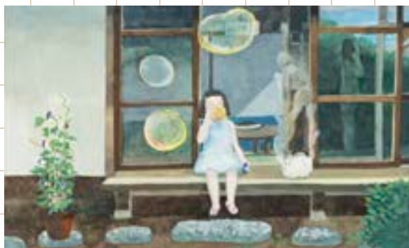
堀川理子《海のアドリエ》2020年 ©堀川理子