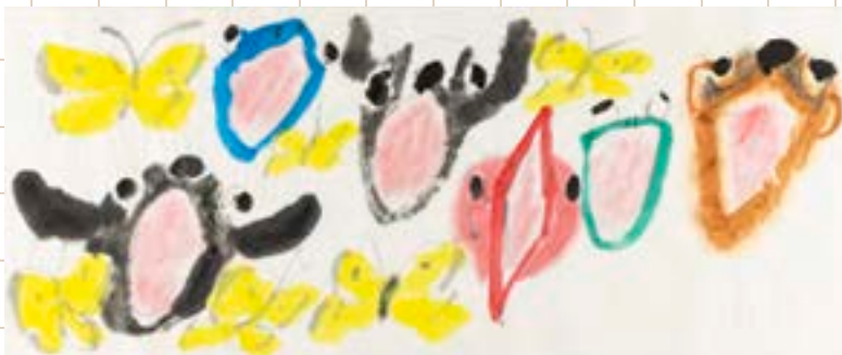
きくちききともだちのいろ 2021年 ©きくちきき