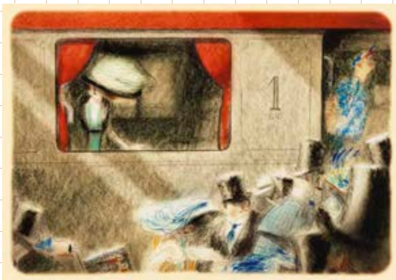
ダニ・トゥレン《一等車の旅》2018-20年 ©Dani Torrent