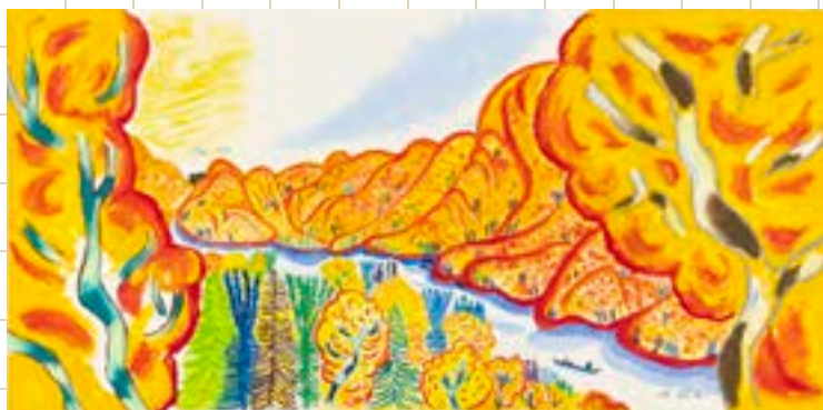
あべ弘士《よあけ》2021年 ©あべ弘士