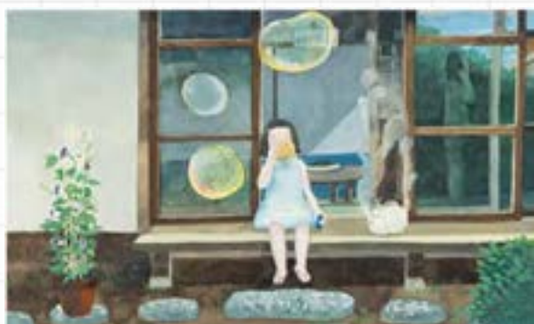
堀川理万子《海のアトリエ》2020年 ©堀川理万子