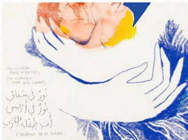
マエヴァ・ルブリ《わたしの街、あなたの街》2019年 ©Maeva Rubli

さらに、千葉市美術館開館30周年を記念して、当館とBIBの20年の歩みを振り返る特別展示も行います。