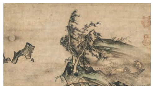
：雪村周継《月夜独釣図》室町時代 旧ピーター・ドラッカーコレクション(千葉市美術館寄託)