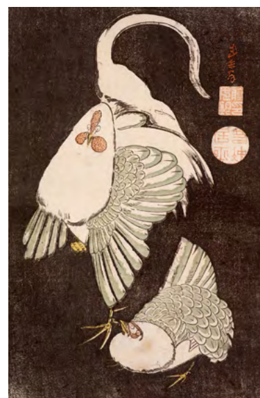
6 伊藤若冲《雌雄鶏図》木版彩色摺 江戸時代 RISD美術館蔵 Courtesy of the Museum of Art, Rhode Island School of Design, Providence Gift of Mrs. John D. Rockefeller, Jr.