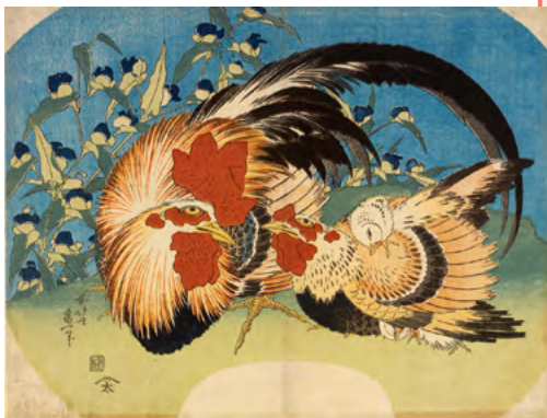
葛飾北斎《霧草に鶏》団扇絵判錦絵 天保3年(1832)頃 RISD美術館蔵 Gift of Mrs. John D. Rockefeller, Jr.

アビー・オールドリッチ・ロックフェラーが収集した初めての花鳥版画である歌川広重《水葵に鴛鴦》、《紫陽花に川蜉》から展示ははじまり、「部屋を花鳥版画で飾る」というアビーの残した言葉のとおり、展示室を花鳥版画に囲まれた生活を想像させるような空間となります。