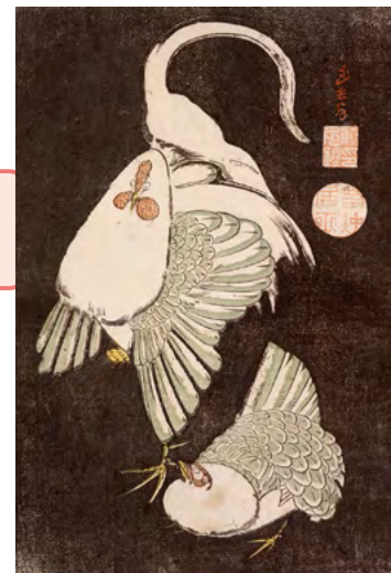
伊藤若冲《雌雄鶏図》木版彩色摺 江戸時代 RISD美術館蔵 Gift of Mrs. John D. Rockefeller, Jr.