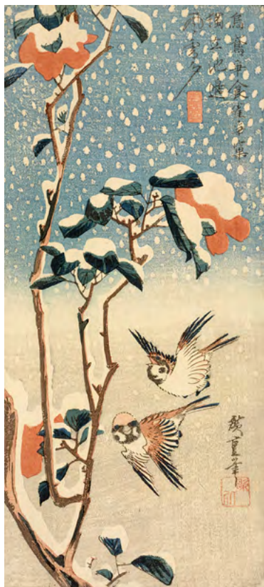
1 歌川広重《雪中樺に雀》大判短冊錦絵 天保3-6年(1832-35) RISD美術館蔵 Courtesy of the Museum of Art, Rhode Island School of Design, Providence Gift of Mrs. John D. Rockefeller, Jr.

展覧会広報用として作品画像をご用意しております。ぜひ、本展をご紹介しますようお願いいたします。 ご紹介いただける場合は、別紙の申込書に必要事項をご記入の上、FAX またはメールにてご連絡ください。 画像の使用は1回限りとし、展覧会紹介の目的にのみご使用ください。