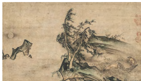
：雪村周継《月夜独釣図》室町時代 旧ピーター・ドラッカーコレクション(千葉市美術館寄託)