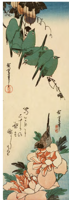
3 歌川広重《烏瓜に目白／芍薬に小鳥》中短冊判錦絵 天保3-6年(1832-35)頃 RISD美術館蔵 Courtesy of the Museum of Art, Rhode Island School of Design, Providence Gift of Mrs. John D. Rockefeller, Jr.