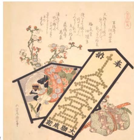
葛飾北斎《馬尽 絵馬》文政5年(1822) 千葉市美術館蔵

摺物とは、贅を尽くした江戸時代の非売品の特注版画です。RISDには千葉市美術館所蔵の「摺物帖」と江戸時代には対であった摺物群が所蔵されており、当館と長年学術交流を続けてきた縁がありました。本展と同時期に千葉市美術館の「摺物帖」を貸出し、RISD Museumにおいて、この縁に光をあてた展覧会 “Deep Cuts: Stories from Two Surimono Albums” が開催される予定です。そこで、千葉市美術館においてもコレクションから摺物を多数展示、同時開催で関連特集を構成いたします。彫りや摺りの技巧の高さに注目しながら、摺物に込められた当時の人々の美意識やこだわりをご紹介します。