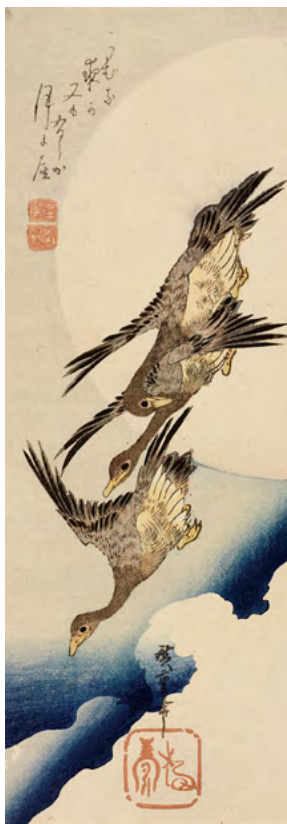
2 歌川広重《月に雁》中短冊判錦絵 天保3-6年(1832-35)頃 RISD美術館蔵 Courtesy of the Museum of Art, Rhode Island School of Design, Providence Gift of Mrs. John D. Rockefeller, Jr.