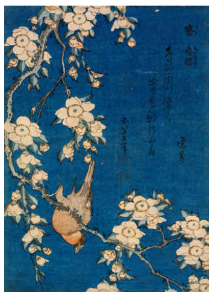
4 葛飾北斎《「鶯 垂桜」》中判錦絵 天保5年(1834)頃 RISD美術館蔵