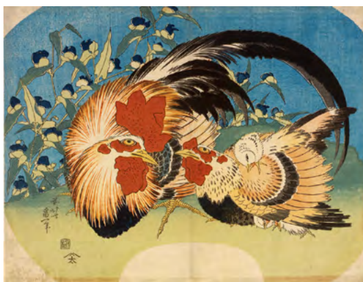
5 葛飾北斎《露草に鶏》団扇絵判錦絵 天保3年(1832)頃 RISD美術館蔵